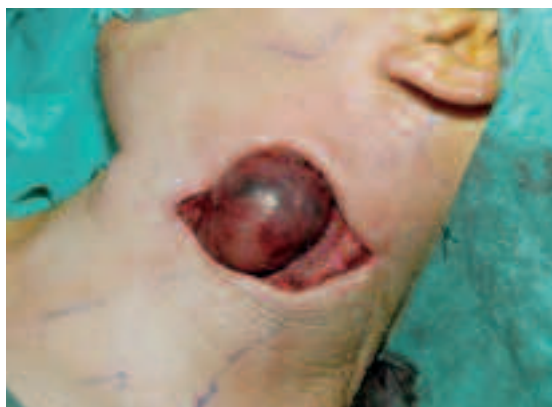
Figuur 2. Peroperatieve afbeelding van de verwijdering van het schwannoom.