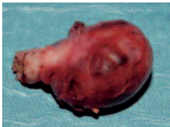
Figuur 3. Het uiteindelijke resectiepreparaat met links de scherp doorgenomen zenuwbundels ter plaatse van de steel.

hyperintens was op de T2-opname. Deze zwelling bleek door te lopen tot in het intervertebrale foramen van C2–C3 en was derhalve suspect voor een residu van het eerder geopereerde schwannoom in de canalis vertebralis (Figuur 1). Besloten werd tot chirurgische verwijdering van het proces, waarbij alleen resectie plaatsvond van het buiten de wervelkolom gelegen deel omdat er op dat moment geen neurologische klachten waren die wezen op myelumcompressie. Figuren 2 en 3 tonen respectievelijk het peroperatieve beeld en het resectiepreparaat. Postoperatief had patiënt geen andere blijvende neurologische uitval dan de eerder beschreven gevoelsstoornis. Nu, twee jaar later, zijn er nog geen aanwijzingen voor recidief tumor.